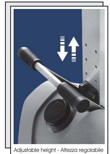
Adjustable height - Altezza regolabile