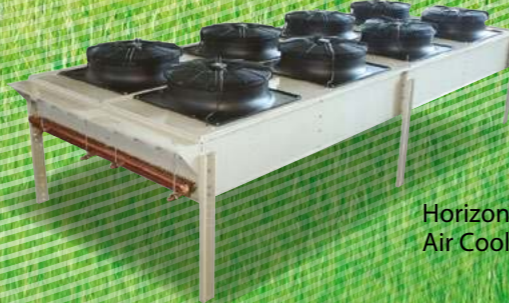
Horizontal Type Air Cooled Condenser