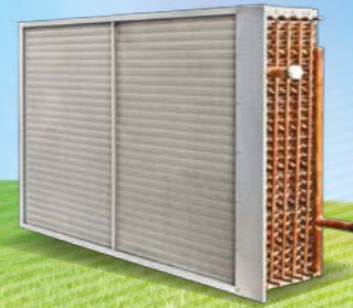
High efficiency heat exchanger for coil energy recovery loop systems