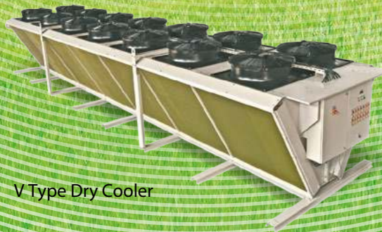
V Type Dry Cooler