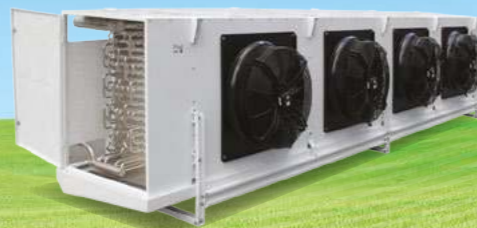
NH 3 Unit Air Cooler Freon Unit Air Cooler